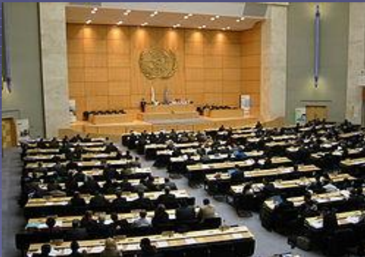
SALA OBRAD W GENEWIE