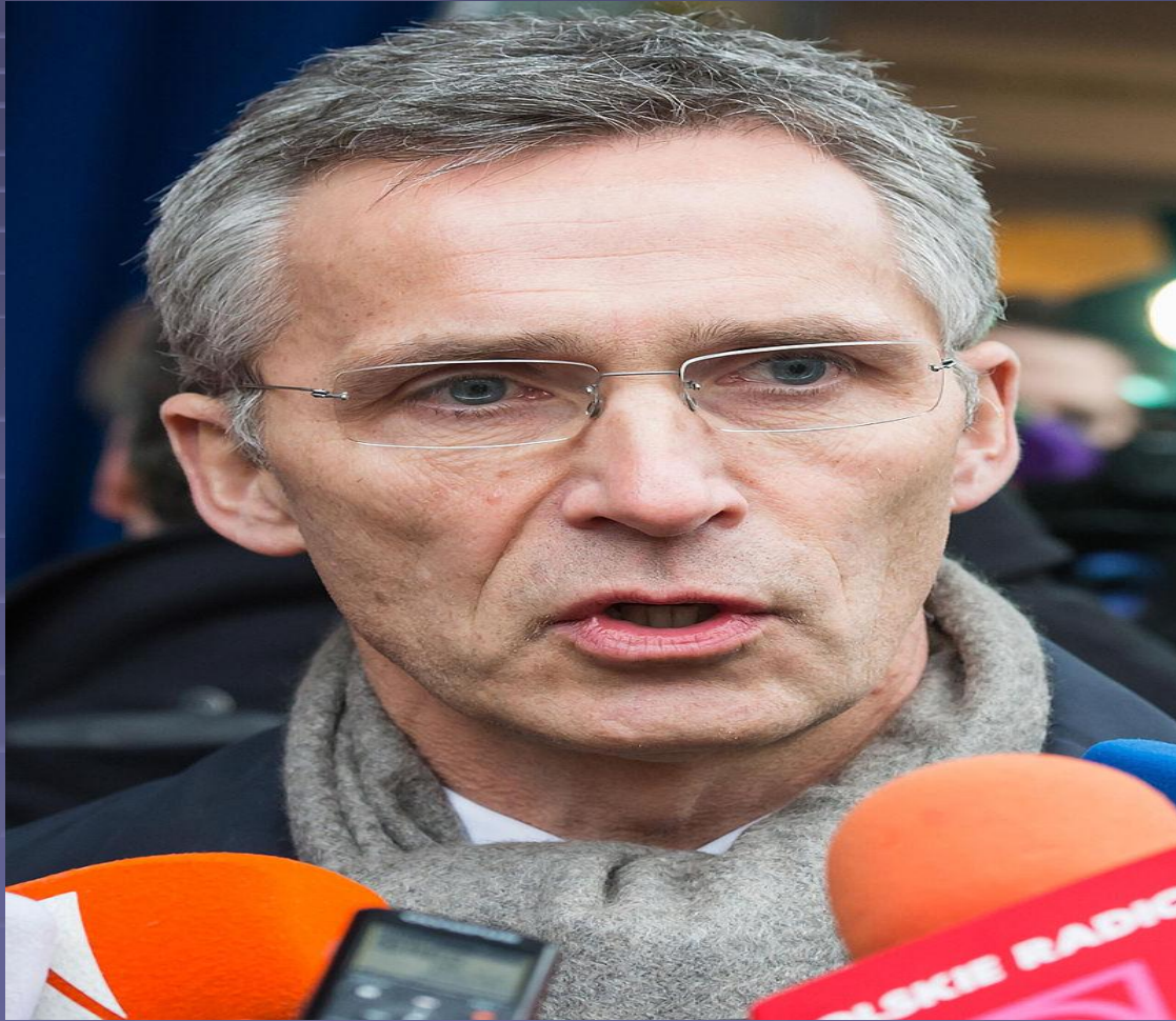
JENS STOLTENBERG (NORWEGIA)